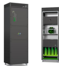
MultiClean L - „anthracite“