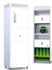
MultiClean L - „traffic white“